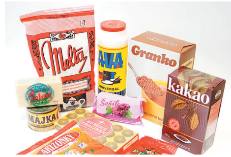
Výrobky budú mať retro obaly.

fec komunikovať i prostredníctvom Instagramu, kde ako medzi prvými značkami na Slovensku vyskúšal reklamy, ktoré doteraz Instagram len testoval na španielskom trhu. Erika Brindzová